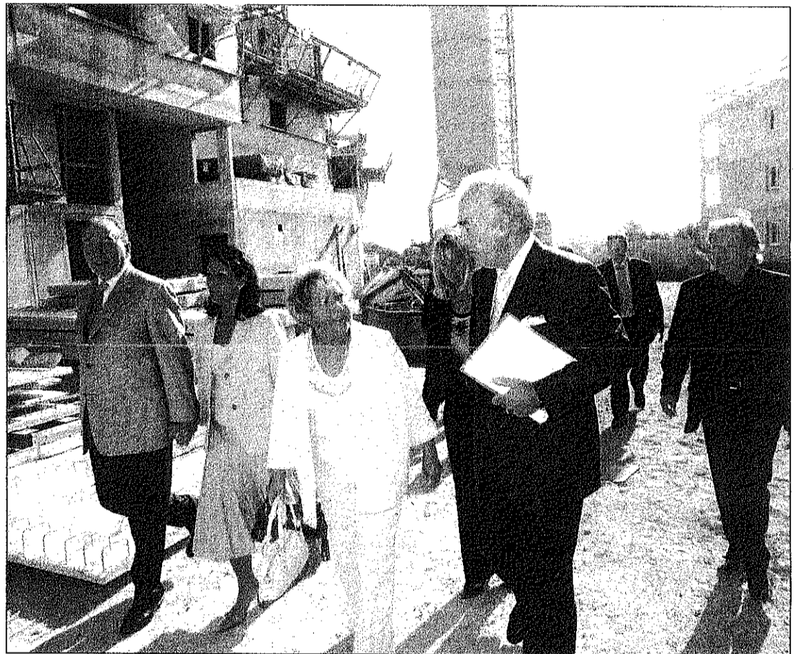
Les personnalités ont visité le chantier des « Florianes » sur lequel s'édifient 160 logements pour actifs. Un chantier déjà bien avancé.

L'occasion pour les deux hommes de se féliciter de cette collaboration dont on peut dire, sans crainte de se tromper, qu'elle inaugure une nouvelle ère pour la Cité du Lion de Mer « merci à tous ceux qui se sont investis dans cette réussite. Elle prouve que Saint-Raphaël est une