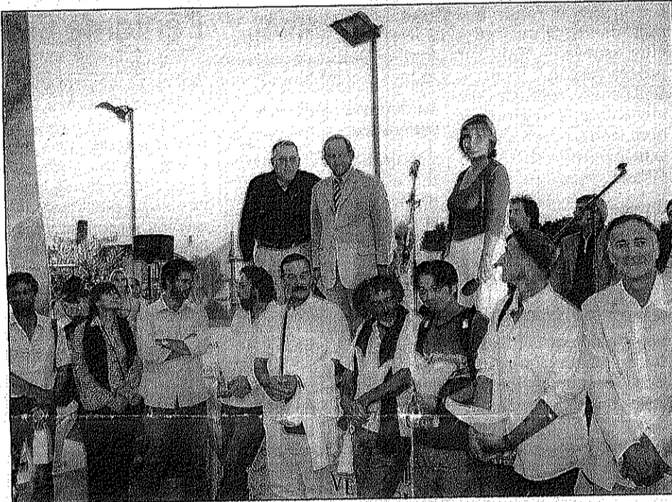
Les artistes, le président du jury, le maire et son adjointe à l'Esthétique urbaine vendredi soir lors de la cérémonie de clôture du Symposium.